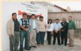
En su amplio recorrido, los consejeros electorales también llegaron al Consejo Distrital X con sede en Tizimin.