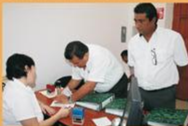
El Partido Verde Ecologista de México también entregó en tiempo y forma la documentación comprobatoria de gastos.

IPEPAC IPEPAC IPEPAC IPEPAC IPEPAC IPEPAC IPEPAC IPEPAC IPEPAC IPEPAC