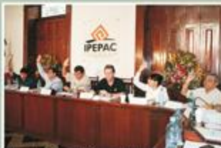
Por votación unánime, los Consejeros Electorales aprobaron el ajuste al presupuesto del 2010.

Como se recordará, el pasado 30 de octubre, el Consejo General aprobó un proyecto de presupuesto de egresos para el 2010 por un monto total de 187 millones 251 mil 959.10 pesos, como se aprecia en la siguiente gráfica: