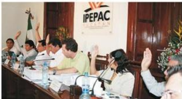
Como se aprecia en la presente gráfica la votación fue por unanimidad.

Al Partido del Trabajo se le aplicó una multa por 31 mil 170 pesos por una falta de carácter formal y calificada como leve. Por su lado, el Partido Verde Ecologista de México fue sancionado con 140 mil 265 pesos por 11 faltas de carácter formal y calificada como leve, haber destinado únicamente el 12.17% del 15% de su financiamiento público del año 2008 para actividades específicas.