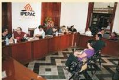
La empresa ganadora del concurso fue "Diseño, Reconstrucción y Comunicación, S.A. de C.V."