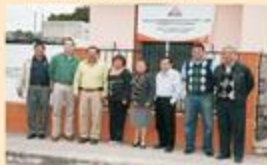
El Consejo Distrital Electoral XI con sede en Valladolid, listo para la organización del proceso.