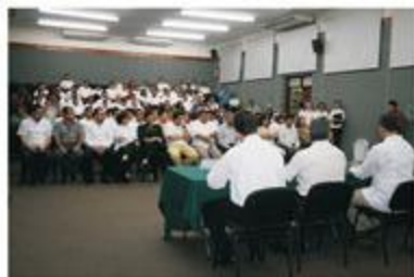
Una panorámica de la firma del convenio de colaboración entre el IPEPAC y la Procuraduría de Justicia del Estado.

Destacó que la Procuraduría de Justicia y el IPEPAC, con la firma del convenio, ponen el ejemplo y dan un paso muy importante, pero deseó que los demás actores políticos en el Estado se sumen a ese esfuerzo y todos, en equipo, conformen un poderoso frente