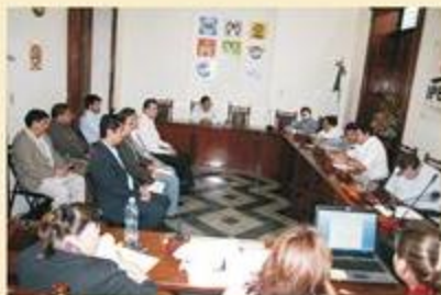
Una panorámica de la junta de aclaraciones de la licitación pública nacional para la elaboración del material electoral.