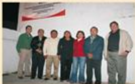
La gira que amarró por la mañana del 14 de enero concluyó por la noche en el Consejo Distrital Electoral XIV en Izamal.