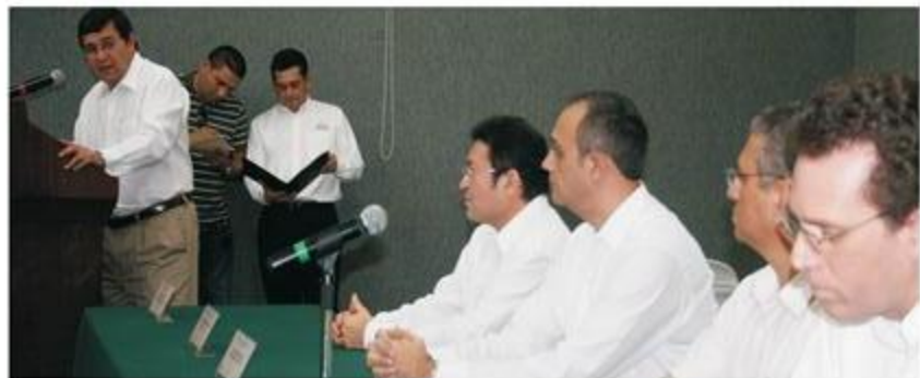
El consejero presidente, al momento de dar la bienvenida y agradecer la firma del documento a las autoridades correspondientes.