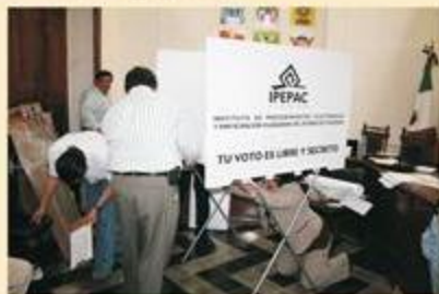
La instalación de una mampara durante la presentación de Propuestas.

La empresa ganadora deberá entregar a más tardar el 17 de marzo las 2,500 cajas para almacenar la documentación electoral y a más tardar, el 9 de abril las 2,500 cajas con el material electoral y las bolsas de plástico para cubrir de la humedad cada caja contenedora.