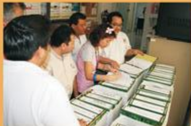
Las cajas que contienen una muestra de la cantidad de documentos que tendrá que revisar la Unidad Técnica de Fiscalización.

IPEPAC IPEPAC IPEPAC IPEPAC IPEPAC IPEPAC IPEPAC IPEPAC IPEPAC IPEPAC