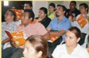
Aspirantes a observadores electorales escuchan con atención la plática que se les ofrece y leen con interés el manual correspondiente.

Cabe hacer notar que para las elecciones del 20 de mayo de 2007, un total de 1,401 ciudadanos obtuvieron su registro como observadores electorales, de los cuales siete fueron extranjeros, seis norteamericanos y un austriaco. Sin embargo, en aquella ocasión hubo elecciones de Gobernador, a diferencia del próximo 16 de mayo que serán elecciones de regidores y diputados.