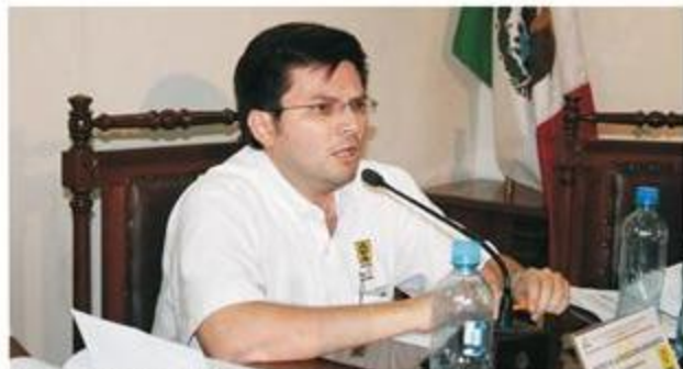
El representante del PRD durante los alegatos en su defensa.