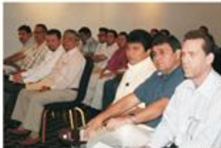
Los consejeros electorales, directores y demás funcionarios del IPEAC durante la sesión de instalación del Comité de Ética Electoral.

Agregó que el desarrollo y crecimiento de la propia sociedad está mutuamente condicionada porque el inicio, el sujeto y el fin de todas las instituciones sociales es la persona humana, la cual por su propia naturaleza tiene absoluta necesidad de la vida social y armónica.