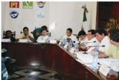
En sesión extraordinaria el pleno del Consejo General decidió multar a los partidos políticos por irregularidades en sus informes.

A su vez, el Partido de la Revolución Democrática fue multado con 469 mil 421.03 pesos, es decir 6 mil salarios mínimos por faltas leves y sólo destinar .45 por ciento del 15 por ciento de su financiamiento público a actividades específicas.