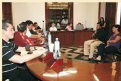
A la junta de fallo de la licitación pública nacional para la elaboración del material electoral sólo llegaron dos empresas.