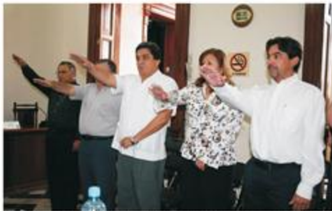
El Procurador de Justicia del Estado y el consejero presidente del IPEPAC al momento de suscribir el convenio de colaboración.

Finalmente, invitó a la sociedad yucateca a colaborar con el Comité con la información adecuada sobre los hechos observados; con una relación congruente entre los hechos y los criterios de juicio éticos, con una visión imparcial y objetiva; con la aportación de circunstancias reales que puedan condicionar el hecho visto y mediante la observación objetiva y con apego estricto a los principios éticos y de legalidad, de todos los actores políticos dentro del Proceso Electoral.