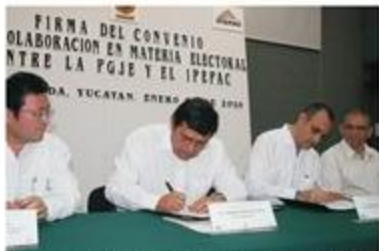
El Procurador de Justicia del Estado y el consejero presidente del IPEPAC, al momento de suscribir el convenio de colaboración.