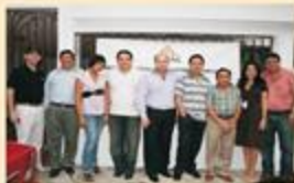
El piano del Consejo Distrital Electoral I acompañado por miembros del Consejo General durante la visita.