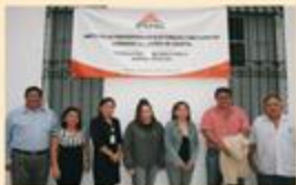
Los consejeros y demás funcionarios del Instituto visitaron también el II Consejo Distrital Electoral con sede en Mérida.