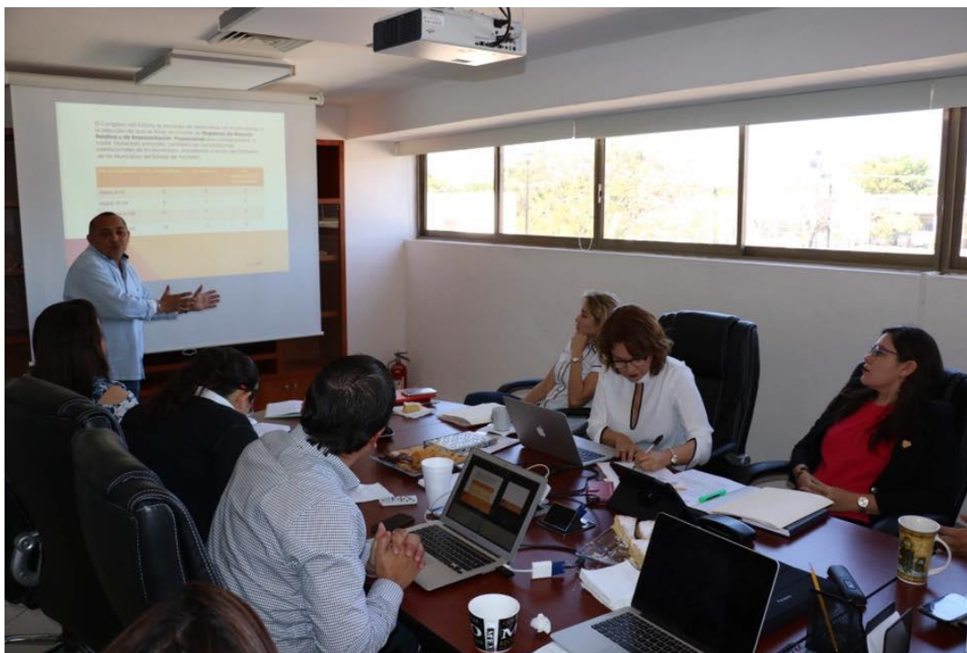
FOTOGRAFÍA 2. MUESTRA A INTEGRANTES DEL CONSEJO DEL CONTENIDO DE LOS CURSOS DE CAPACITACIÓN.