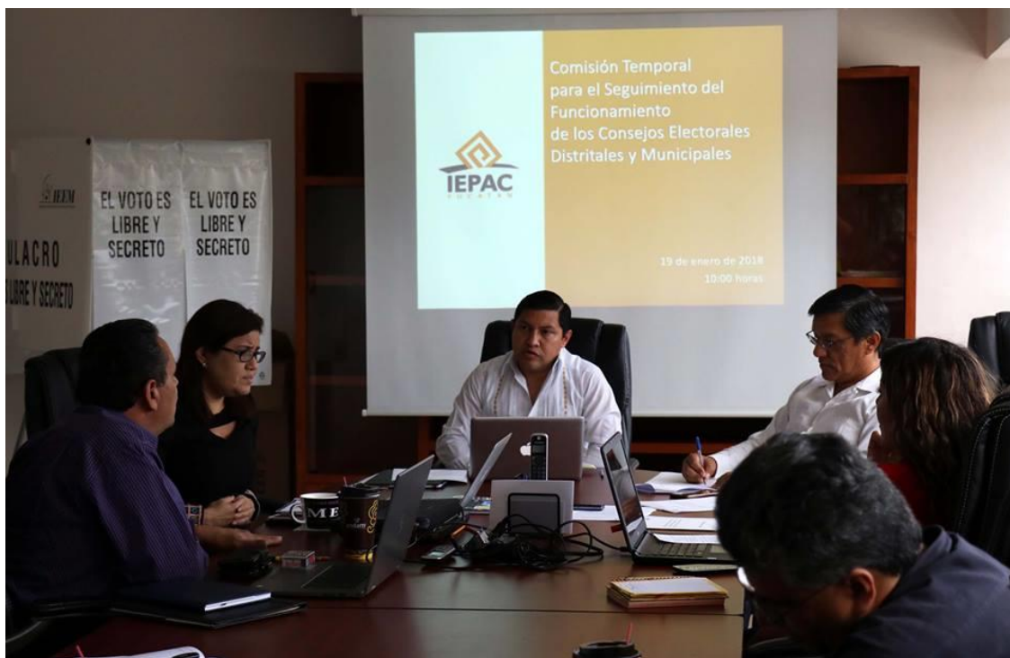
FOTOGRAFÍA 6. SESIÓN DE LA COMISIÓN TEMPORAL.