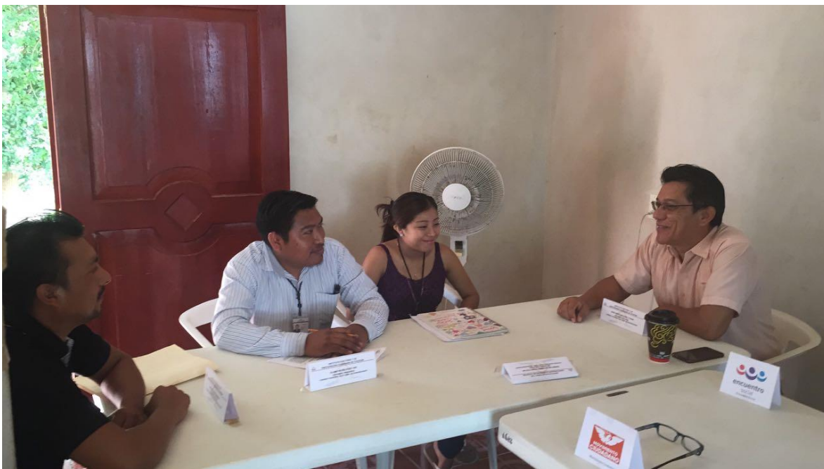
FOTOGRAFÍA 15. PERSPECTIVA DE VISITA DE LOS INTEGRANTES DE LA COMISIÓN TEMPORAL A CONSEJOS ELECTORALES DISTRITALES Y MUNICIPALES.