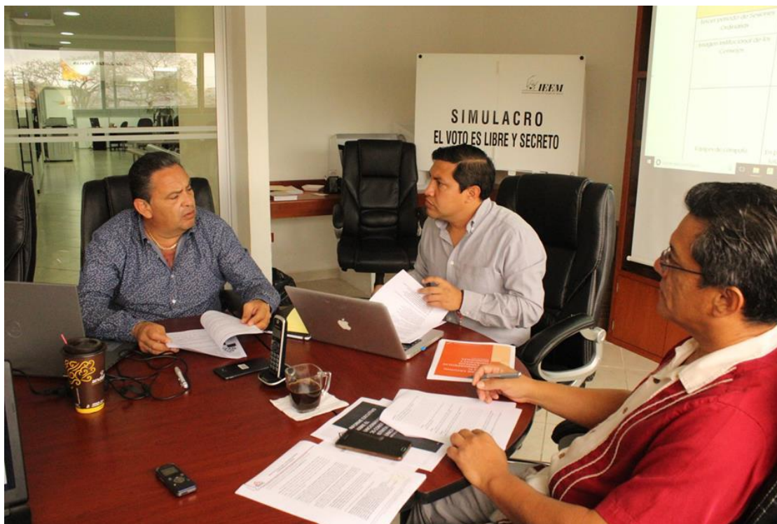
FOTOGRAFÍA 18. SESIÓN DE LA COMISIÓN TEMPORAL.