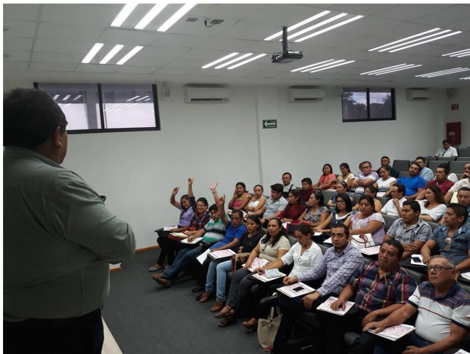
FOTOGRAFÍA 4. PERSPECTIVA DE CURSO DE CAPACITACIÓN A INTEGRANTES DE LOS CONSEJOS ELECTORALES DISTRITALES Y MUNICIPALES.