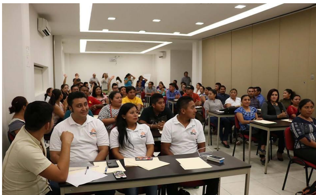
FOTOGRAFÍA 11. PERSPECTIVA DE CURSO DE CAPACITACIÓN A INTEGRANTES DE LOS CONSEJOS ELECTORALES DISTRITALES Y MUNICIPALES.