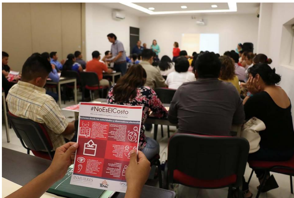
FOTOGRAFÍA 5. PERSPECTIVA DE CURSO DE CAPACITACIÓN A INTEGRANTES DE LOS CONSEJOS ELECTORALES DISTRITALES Y MUNICIPALES.