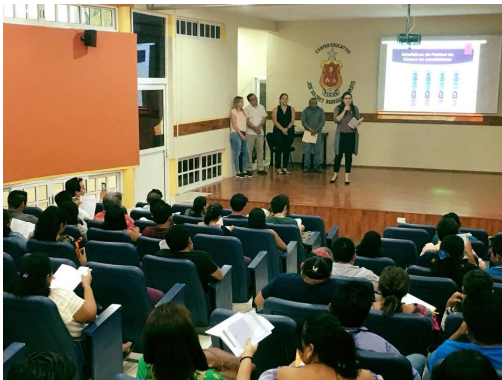
FOTOGRAFÍA 10. PERSPECTIVA DE CURSO DE CAPACITACIÓN A INTEGRANTES DE LOS CONSEJOS ELECTORALES DISTRITALES Y MUNICIPALES.