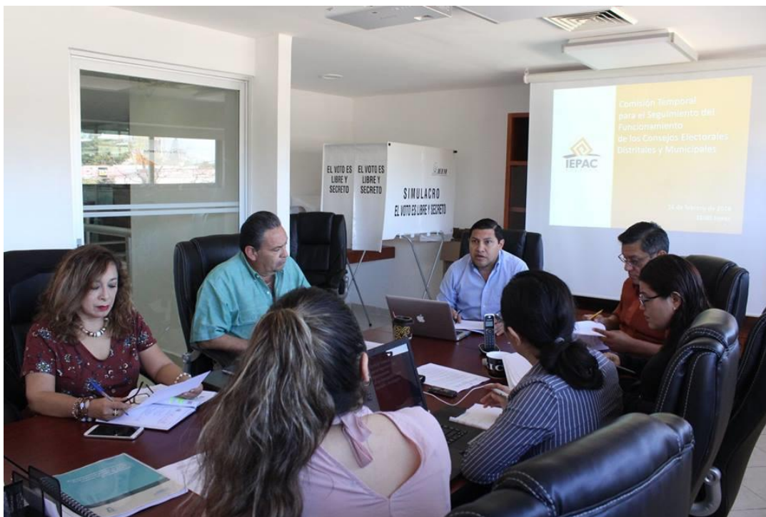
FOTOGRAFÍA 17. SESIÓN DE LA COMISIÓN TEMPORAL.