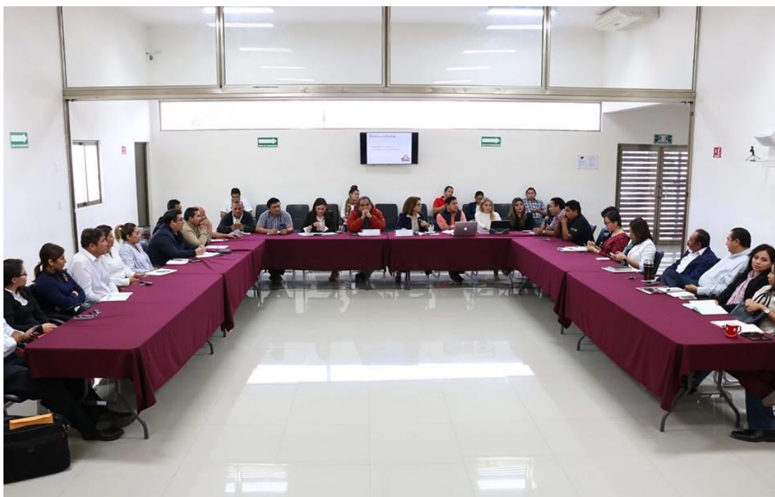
FOTOGRAFÍA 7. REUNIÓN CON COORDINADORES PARA EL CONOCIMIENTO DE NECESIDADES Y CONDICIONES DE LOS CONSEJOS.