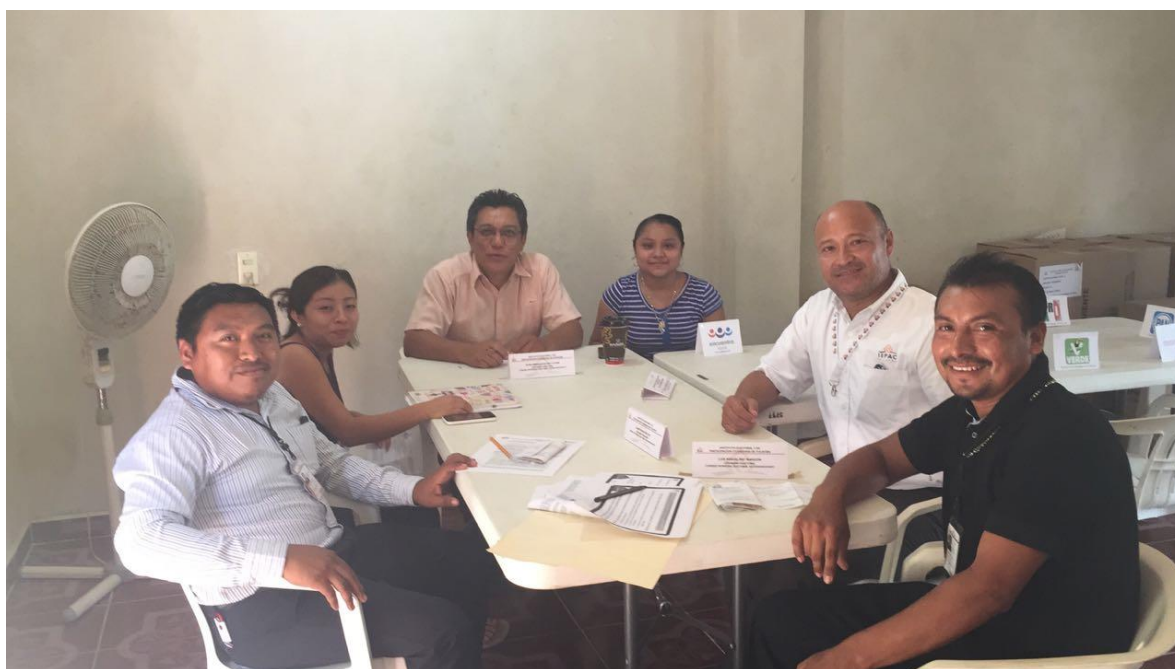
FOTOGRAFÍA 16. PERSPECTIVA DE VISITA DE LOS INTEGRANTES DE LA COMISIÓN TEMPORAL A CONSEJOS ELECTORALES DISTRITALES Y MUNICIPALES.