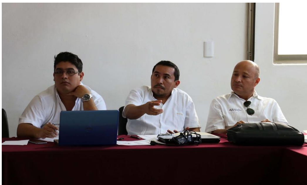
FOTOGRAFÍA 9. PARTICIPACIÓN DE COORDINADORES DISTRITALES EN EL TALLER DIRIGIDO A COORDINADORES.