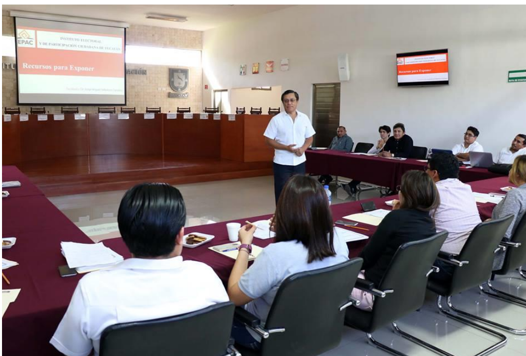
FOTOGRAFÍA 8. TALLER DIRIGIDO A COORDINADORES DISTRITALES PARA FORTALECER LA ASESORÍA QUE ÉSTOS BRINDAN A INTEGRANTES DE LOS CONSEJOS ELECTORALES.