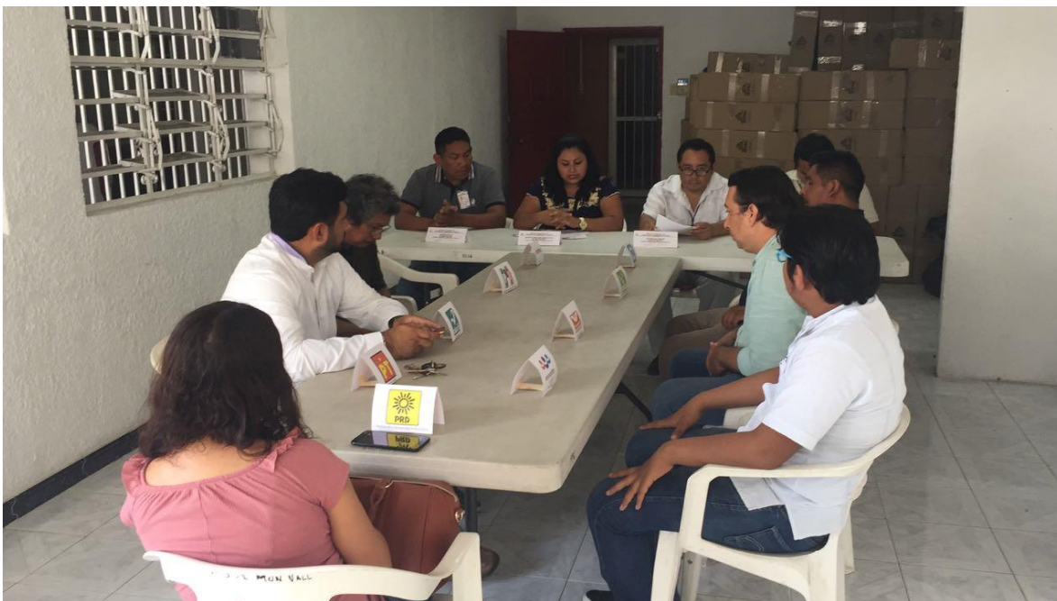
FOTOGRAFÍA 12. IMAGEN INSTITUCIONAL EN LOS CONSEJOS.