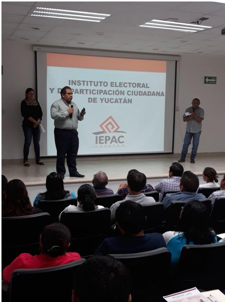
FOTOGRAFÍA 3. PERSPECTIVA DE CURSO DE CAPACITACIÓN A INTEGRANTES DE LOS CONSEJOS ELECTORALES DISTRITALES Y MUNICIPALES.