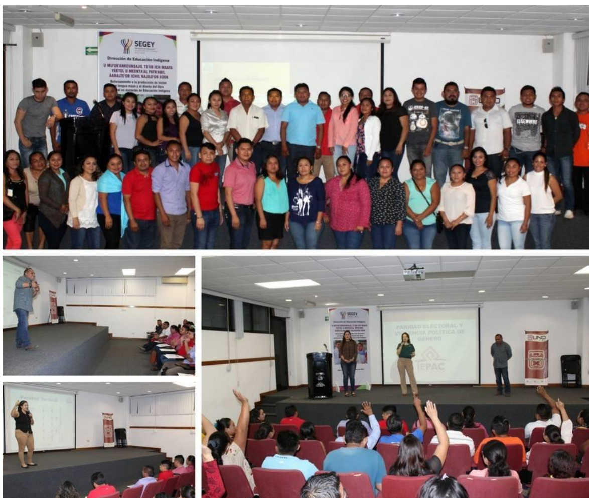
FOTOGRAFÍA 14. PERSPECTIVA CAPACITACIÓN DIRIGIDA A INTEGRANTES DE LOS CONSEJOS ELECTORALES DISTRITALES Y MUNICIPALES.