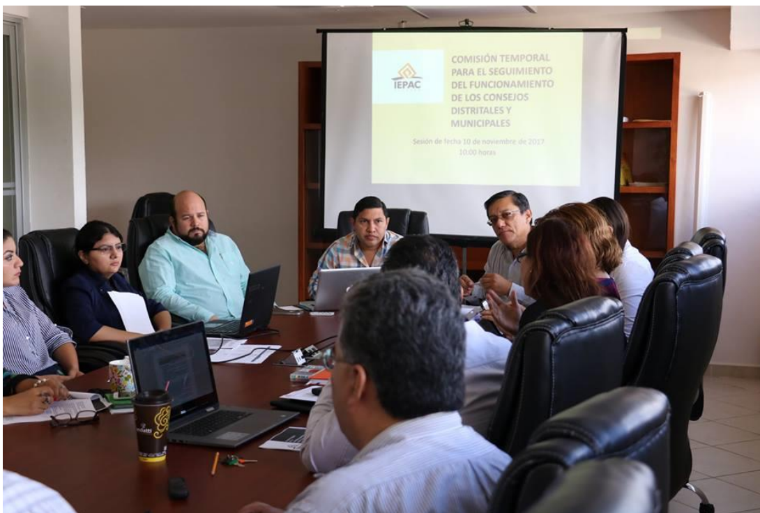
FOTOGRAFÍA 1. SESIÓN DE LA COMISIÓN TEMPORAL.