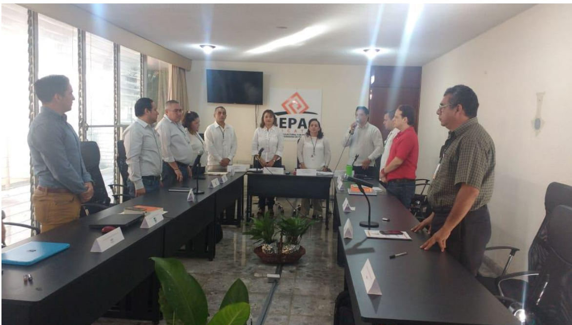
FOTOGRAFÍA 13. IMAGEN INSTITUCIONAL EN LOS CONSEJOS.