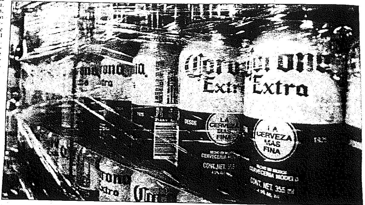
Inauguración de la plata envasadora de Grupo Modelo

De cada 10 cervezas Corona que se producen en Hunucmá, cuatro son exportadas a otras naciones. El plan de Grupo Modelo es exportar desde Progreso a los mercados de Inglaterra, Canadá, Italia, Francia, Sudáfrica, entre otros países europeos.